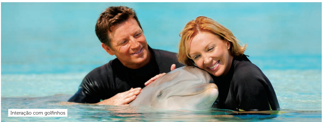
Interação com golfinhos