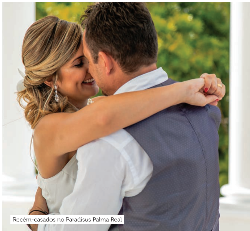
Recém-casados no Paradisus Palma Real