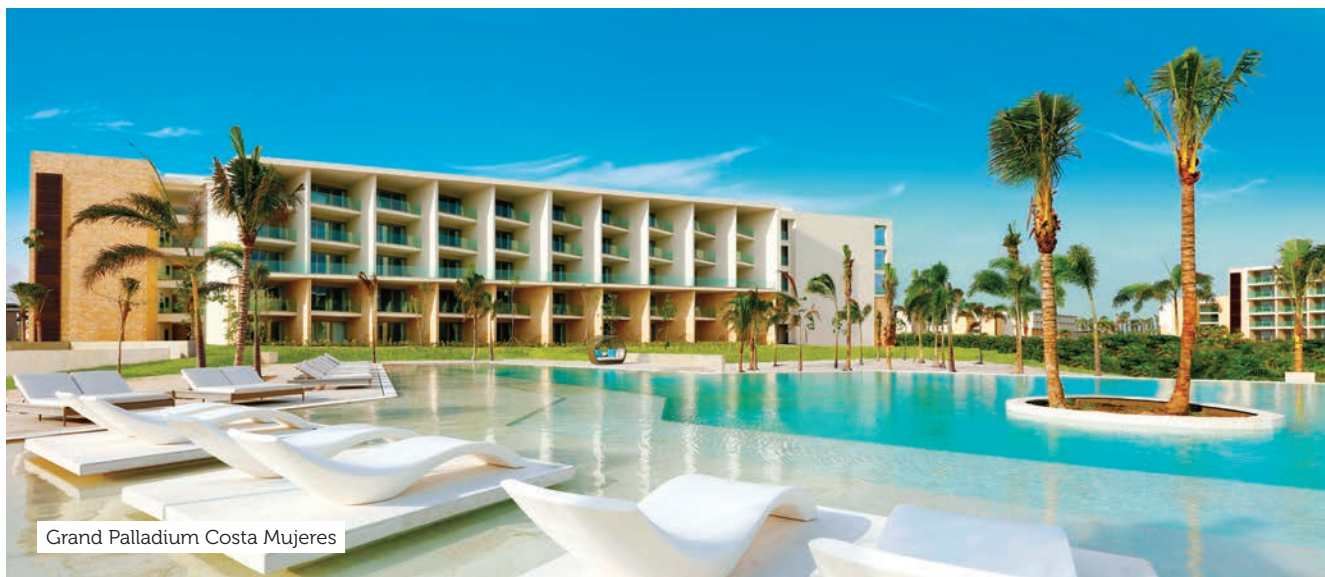
Grand Palladium Costa Mujeres