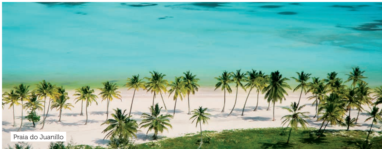
Praia do Juanillo