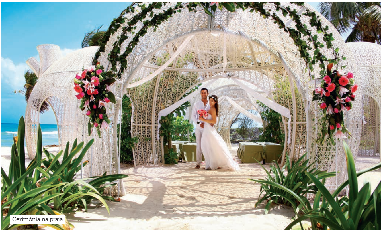
Cerimônia na praia

Pacote para 50 pessoas hospedadas no hotel. Exclusivo para o mercado brasileiro.