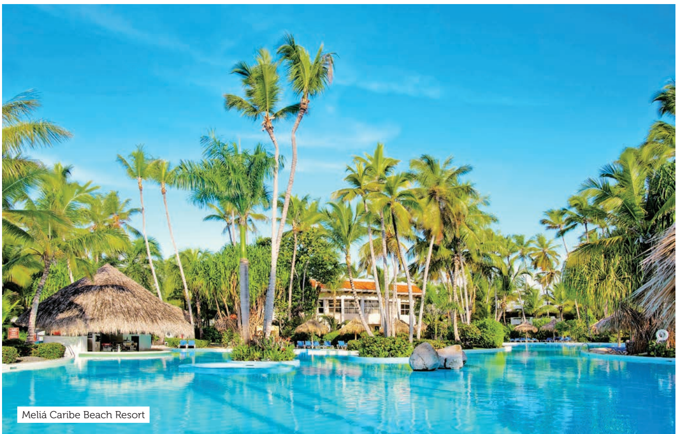
Meliá Caribe Beach Resort

Consulte na CVC os valores dos pacotes que podem ter esses itens.