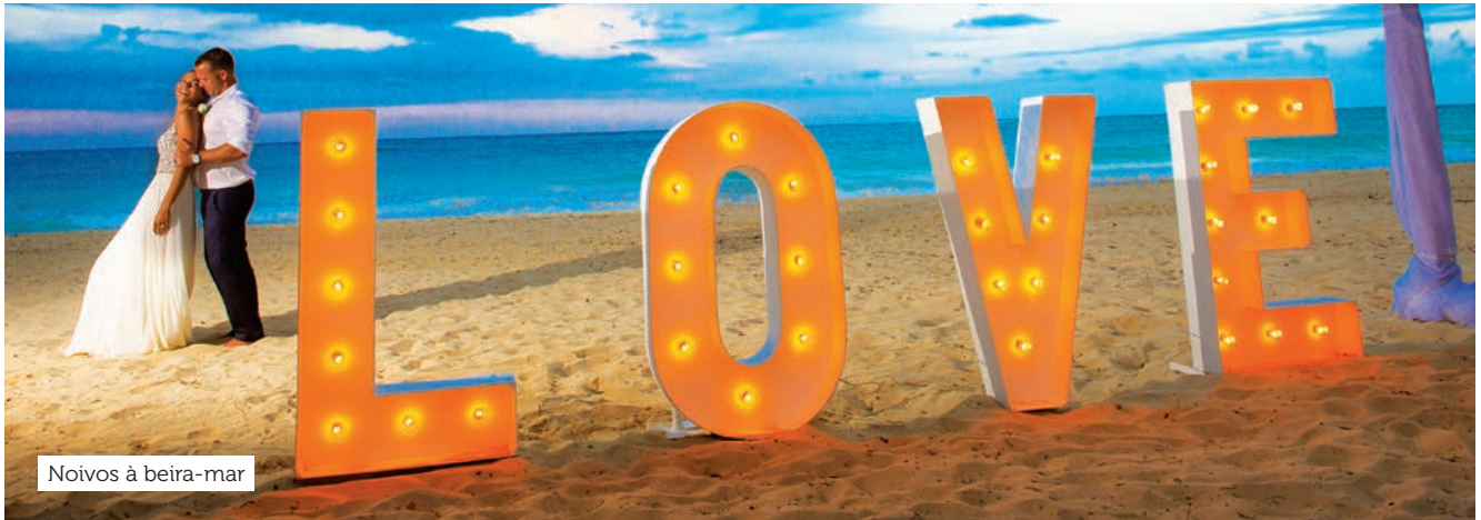
Noivos à beira-mar