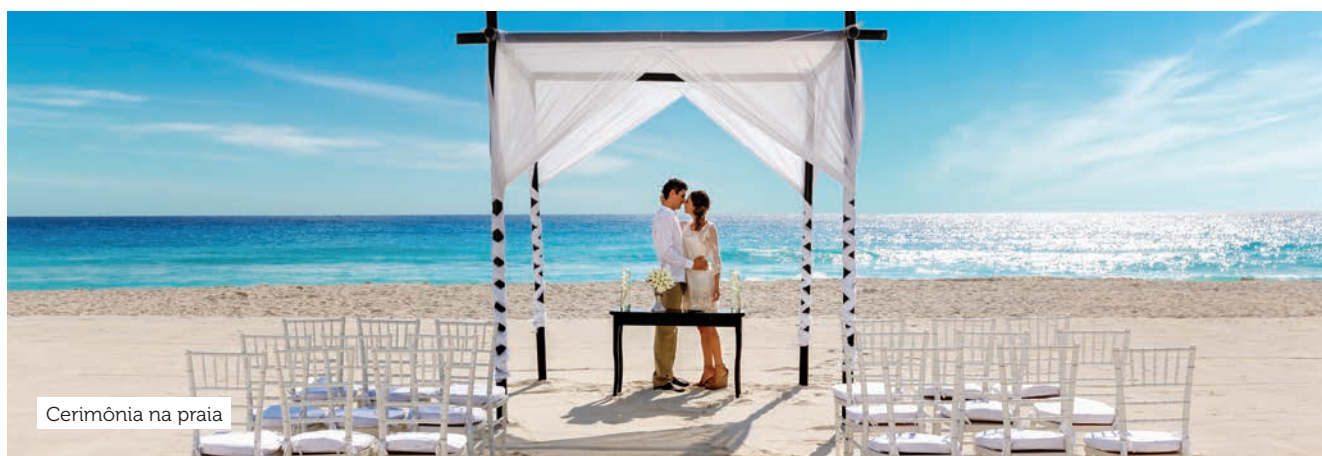
Cerimônia na praia

A rede Palace tem dois resorts à beira-mar, com sistema Tudo Incluído, assistidos pelo aeroporto internacional de Cancún: o Beach Palace , na zona Hoteleira de Cancún, e o Moon Palace Cancún , na Riviera Maya. O primeiro tem cinco bares e quatro restaurantes, três piscinas (duas delas no terraço), três hidromassagens ao ar livre e toboáguas. O Terraço Sky, todo envidraçado, e a praia são as locações preferidas para a cerimônia e a festa de casamento. Já o Moon Palace Cancún tem 12 restaurantes, dez bares, cinco piscinas, seis hidromassagem ao ar livre, discoteca, lounge para adolescentes, campo de golfe, simulador de surfe e salão de beleza para o dia da noiva. As encantadoras cerimônias de casamento são realizadas em terraços, jardins, capela, gazebos e na praia. Os hotéis oferecerem créditos para seus hóspedes, que variam de US$ 500 a US$ 2.500, para serviços opcionais. Outra vantagem é que os menores de 18 anos se hospedam gratuitamente nos resorts.