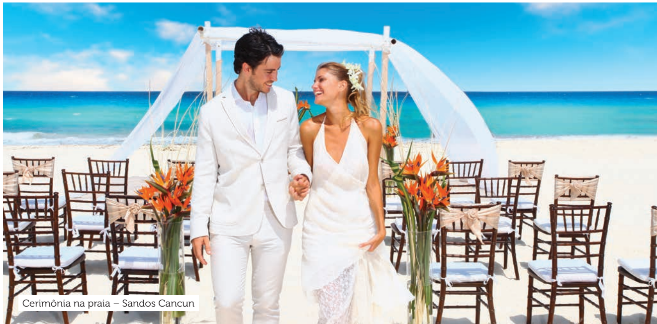
Cerimônia na praia – Sandos Cancun

😊😊😊😊😊 Categoria Luxo • ✅✅✅ Excelente custo/benefício