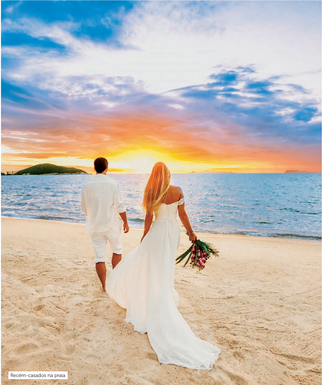
Recém-casados na praia