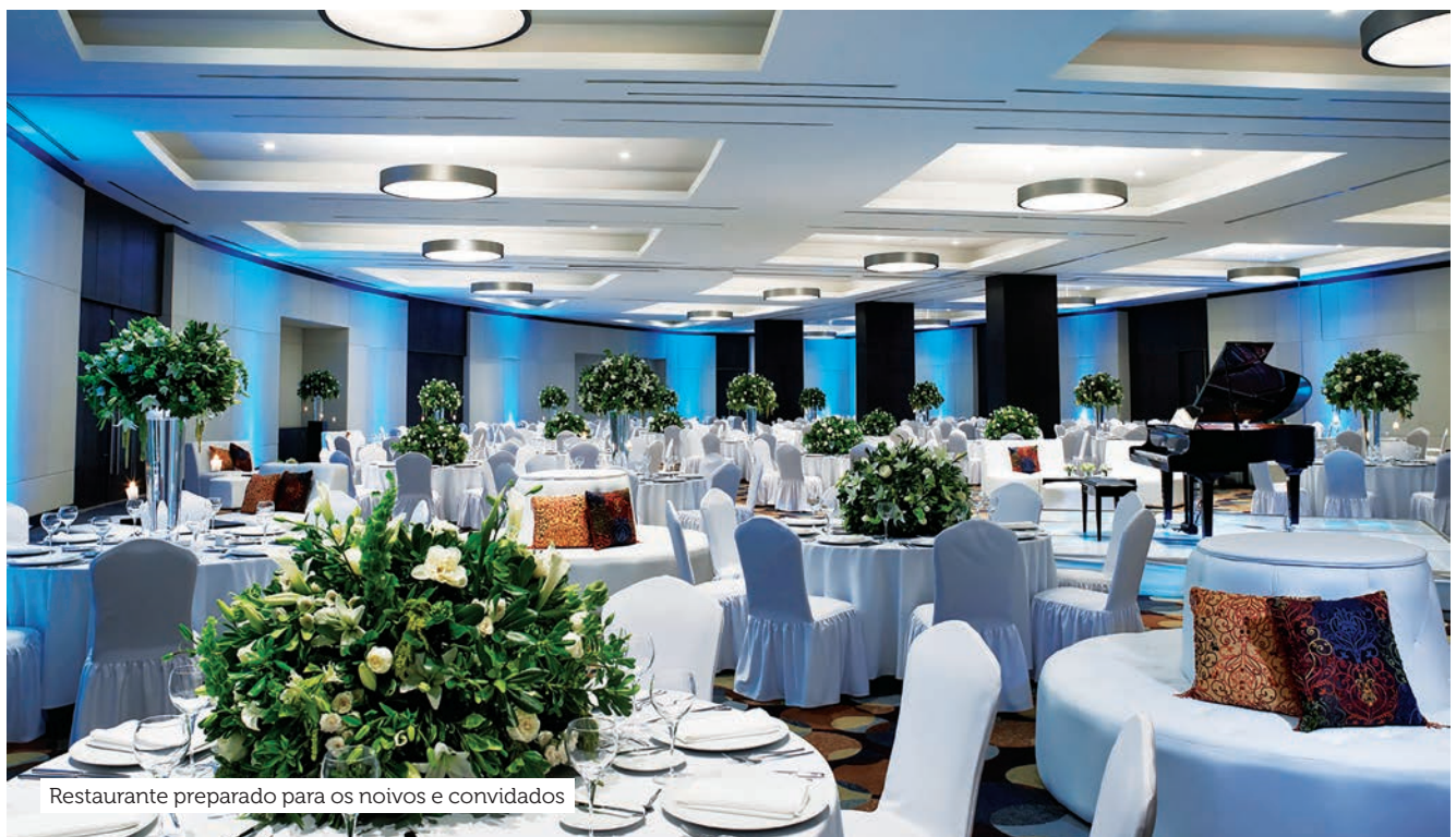
Restaurante preparado para os noivos e convidados