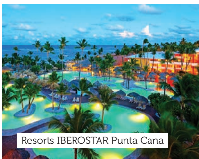
Resorts IBEROSTAR Punta Cana