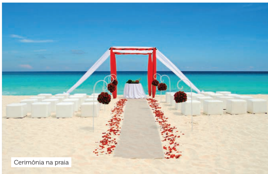
Cerimônia na praia

Consulte na CVC os valores dos pacotes que podem ter esses itens.