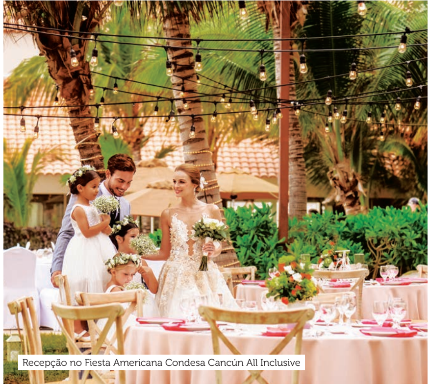
Recepção no Fiesta Americana Condessa Cancún All Inclusive

Pacote para até 20 pessoas. Para mais convidados, há custos extras.