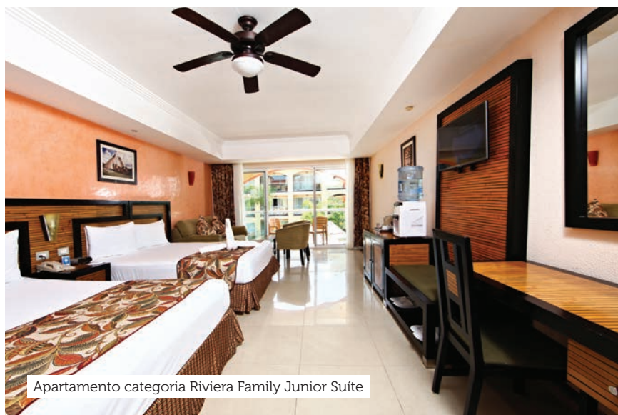
Apartamento categoria Riviera Family Junior Suite

Localizado à beira-mar, fica na praia de Playacar, a 5 km do restaurante temático Señor Frog's, em Playa del Carmen. O resort Tudo Incluído tem dez restaurantes, um café e nove bares. Os hóspedes se divertem com a recreação diária, o entretenimento noturno, a academia, os clubes para crianças e adolescentes, as duas quadras de tênis e os esportes aquáticos. À noite, a animação continua na Gran Plaza, com coquetéis e shows ao vivo sob as estrelas. Adultos em busca de privacidade contam com uma área exclusiva chamada Select Club Adults, com hidromassagem, piscina, restaurantes, discoteca, spa e bares. Os 819 apartamentos são muito bem equipados. Os hóspedes do Sandos Playacar Beach Resort podem utilizar as instalações do Sandos Caracol Eco Resort, também na Riviera Maya, mas o transporte até lá não está incluído.