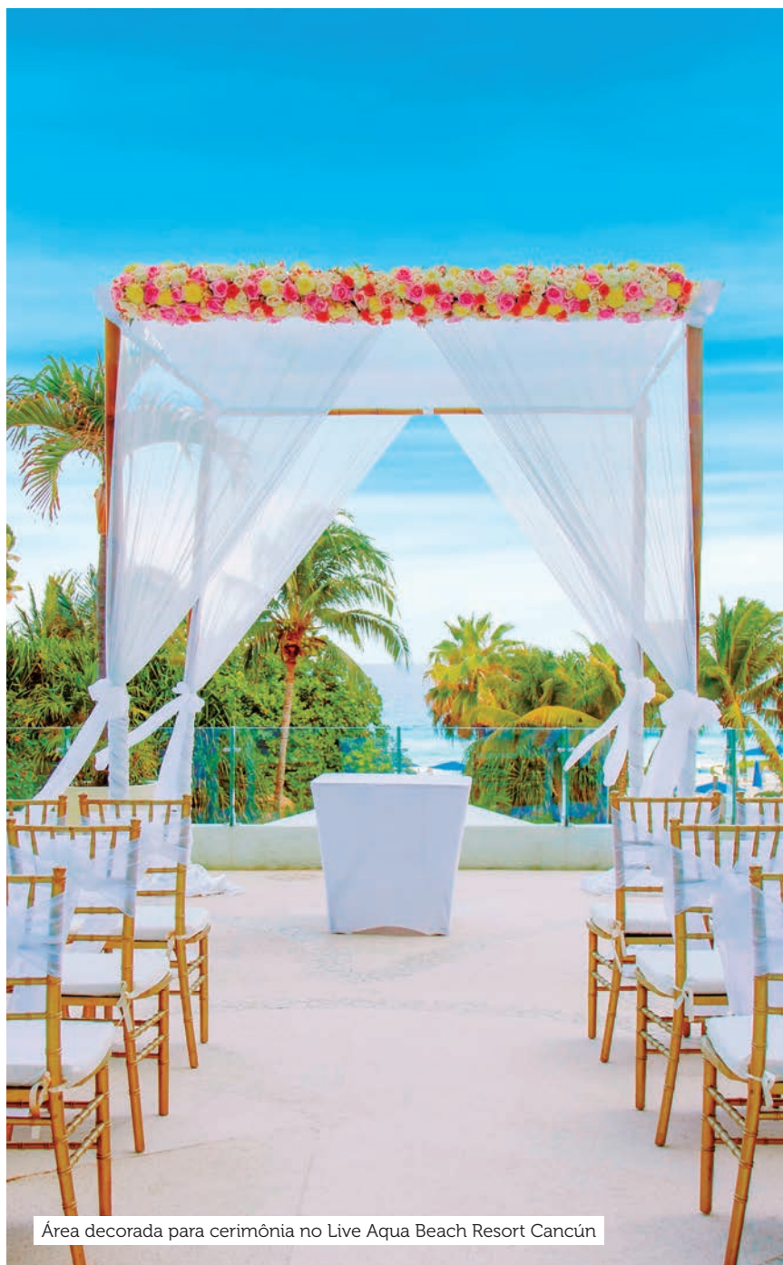
Área decorada para cerimônia no Live Aqua Beach Resort Cancún