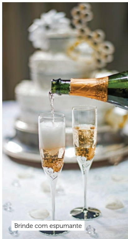
Brinde com espumante

Localizada à beira-mar, esse resort fica em Costa Mujeres, uma nova região turística de Cancún com lindas paisagens naturais intocadas, mais tranquilas e exclusivas, perfeitas para famílias e casais apaixonados. Com sistema Tudo Incluído, o Grand Palladium Costa Mujeres tem nove restaurantes, 15 bares, quatro piscinas, clube para crianças e adolescentes e atividades de recreação diárias. Também tem campo de futebol, campo de minigolfe, quadras de tênis, clínica de tênis Rafael Nadal, amplo spa e 670 apartamentos com hidromassagem e varanda ou terraço.