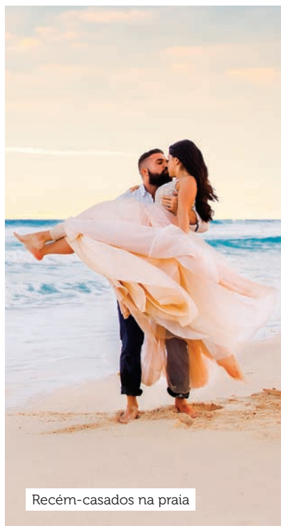
Recém-casados na praia