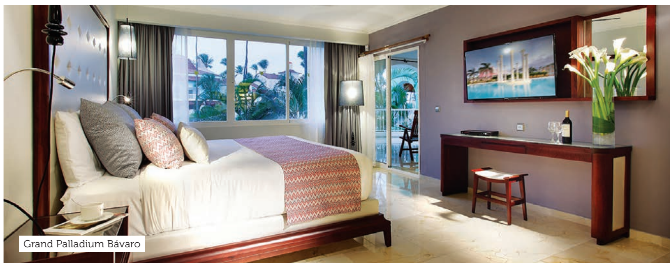
Grand Palladium Bávaro