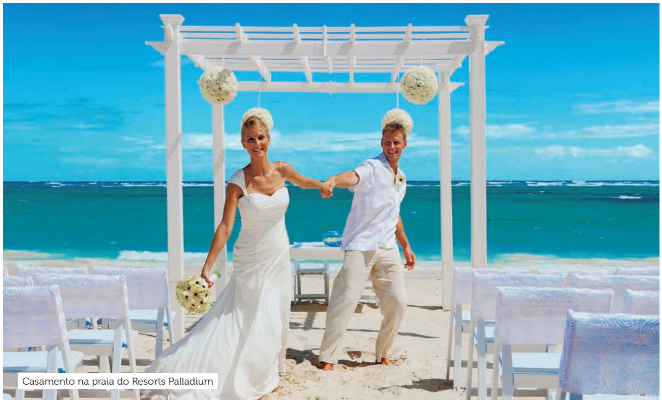
Casamento na praia do Resorts Palladium

Consulte na CVC os valores dos pacotes que podem ter esses itens.