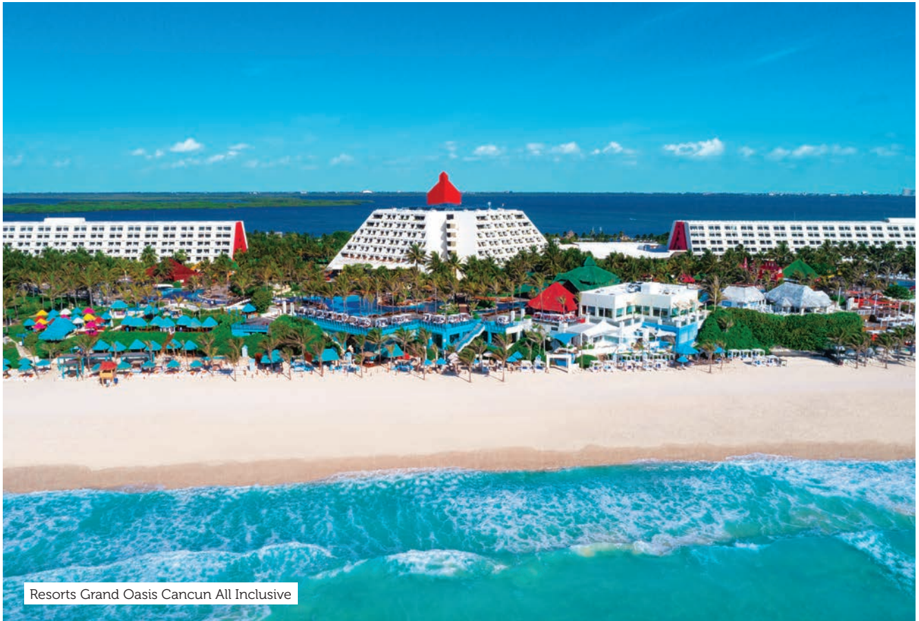
Resorts Grand Oasis Cancun All Inclusive