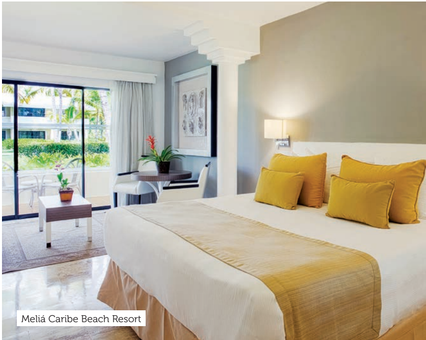
Meliá Caribe Beach Resort