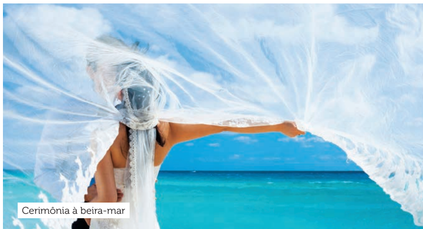
Cerimônia à beira-mar

Pacote para até 25 pessoas. Para mais convidados, há custos extras.