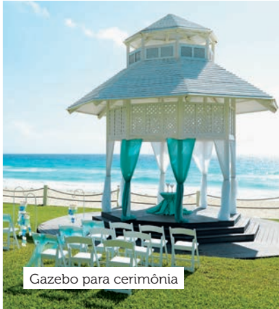
Gazebo para cerimônia