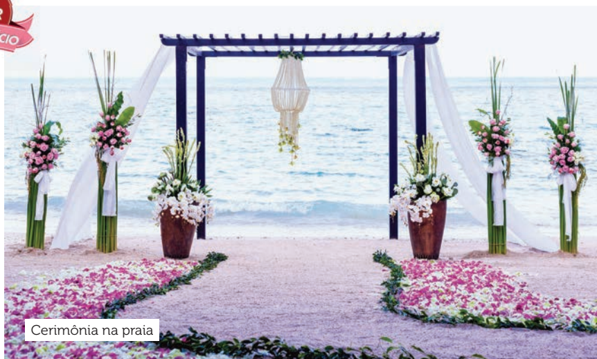
Cerimônia na praia

Pacote para até dez pessoas. Para mais convidados, há custos extras. Este pacote é cortesia para reserva de cinco apartamentos com uma estadia mínima de quatro diárias em qualquer categoria de quartos ou para sete diárias na Suíte Junior Swim-Out Romance Serenity Club Ocean Front.