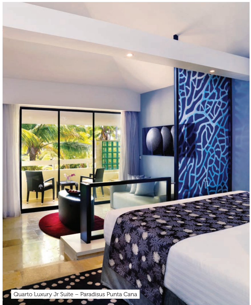
Quarto Luxury Jr Suite – Paradisus Punta Cana

Consulte na CVC os valores dos pacotes que podem ter esses itens.