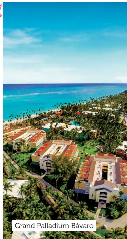
Grand Palladium Bávaro