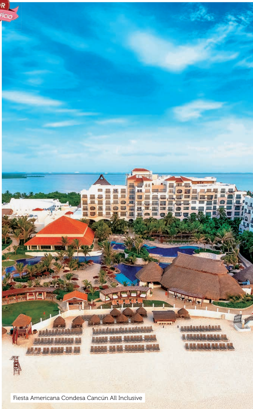
Fiesta Americana Condesa Cancún All Inclusive