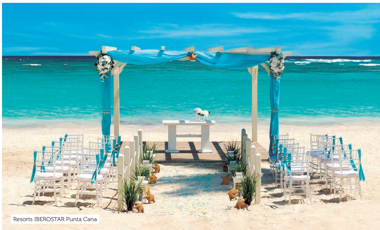
Resorts IBEROSTAR Punta Cana

IBEROSTAR Bávaro, IBEROSTAR Punta Cana e IBEROSTAR Dominicana. A rede também tem outros hotéis localizados na República Dominicana, fora de Punta Cana, que aceitam o pacote. São eles: IBEROSTAR Hacienda Dominicus (localizado na praia de Bayahide, a 70 km de Punta Cana) e IBEROSTAR Costa Dorada (situado em Puerto Plata, a 426 km de Punta Cana).