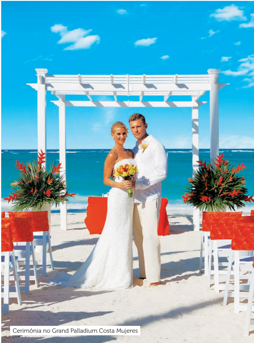
Cerimônia no Grand Palladium Costa Mujeres