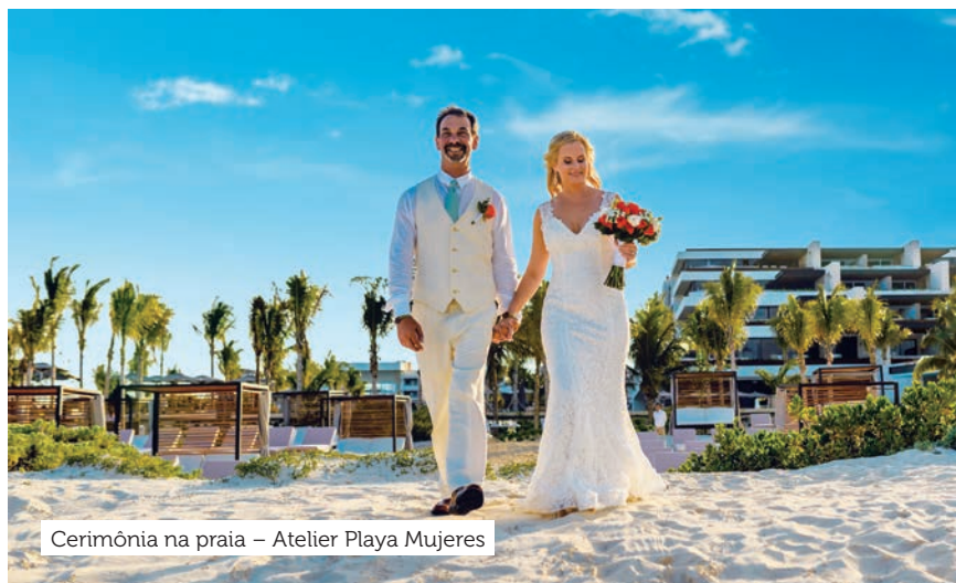
Cerimônia na praia – Atelier Playa Mujeres

Localizado à beira-mar, o Atelier Playa Mujeres tem sistema Tudo Incluído e é exclusivo para maiores de 16 anos. Fica em Costa Mujeres, a nova Zona Hoteleira de Cancún. Sua arquitetura é totalmente inspirada no México Contemporâneo. São oito restaurantes de especialidade, sete bares, campo de golfe 18 buracos, quadras de tênis, piscinas, spa e esportes aquáticos não motorizados. Os luxuosos apartamentos contam com amenidades da badalada grife Molton Brown, banheira e piso de mármore no banheiro. Assim, são perfeitos para casais apaixonados. As impecáveis cerimônias de casamento têm o conceito de “bodas feitas a mão”, tornando personalizada cada experiência. Podem ser realizadas na praia, em um terraço com lindas paisagens ou na intimidade de uma sala de eventos.