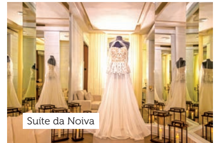
Suite da Noiva