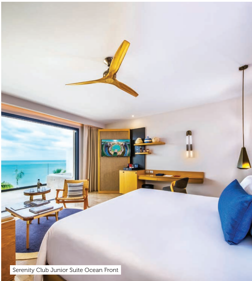
Serenity Club Junior Suite Ocean Front

Pacote para até 20 pessoas. Para mais convidados, há custos extras.