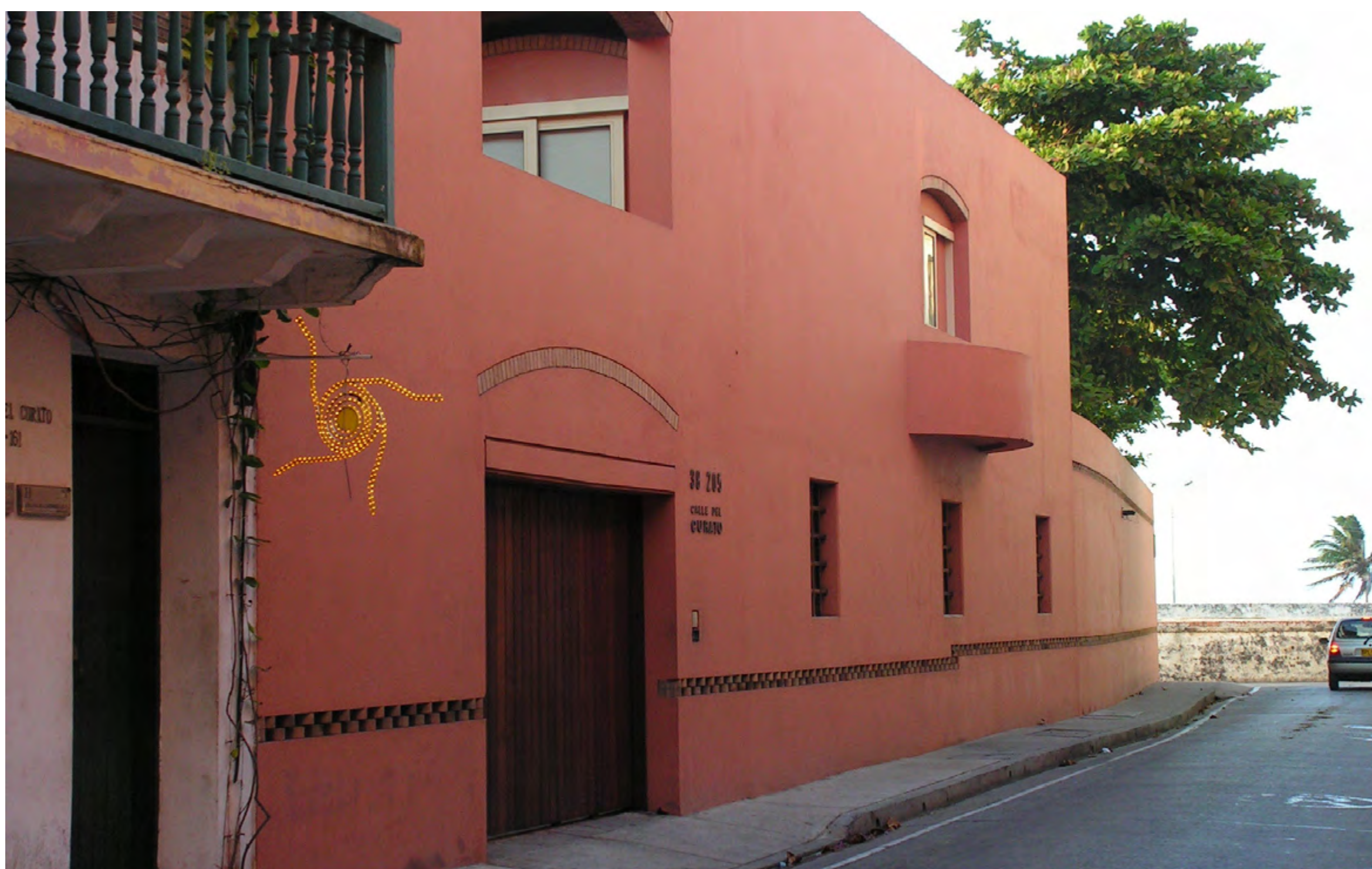
CASA DE GABRIEL GARCÍA MÁRQUEZ

Para conter os avanços de inimigos, os espanhóis construíram sobre o monte São Lázaro a maior fortaleza de todas as suas colônias americanas. No século 18, o forte bloqueou o avanço de tropas britânicas – dizem que, se não fosse pela estrutura militar de Cartagena, a América do Sul, hoje, falaria inglês. Do castelo, que fica fora da zona amuralhada, é ampla a vista sobre a Baía de Cartagena; e também é possível percorrer os estreitos corredores por onde antes circulavam os soldados.