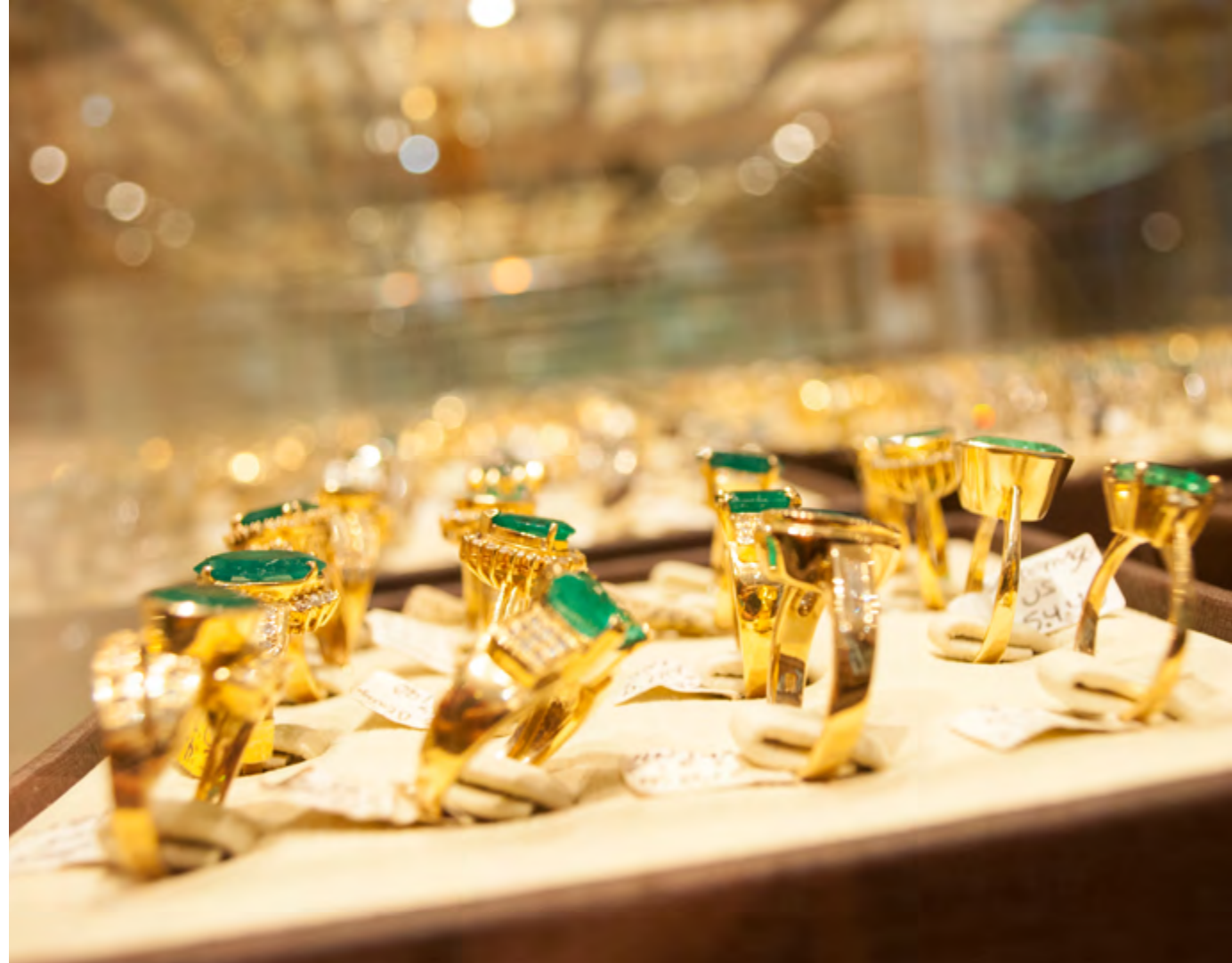
JOIAS COM ESMERALDA