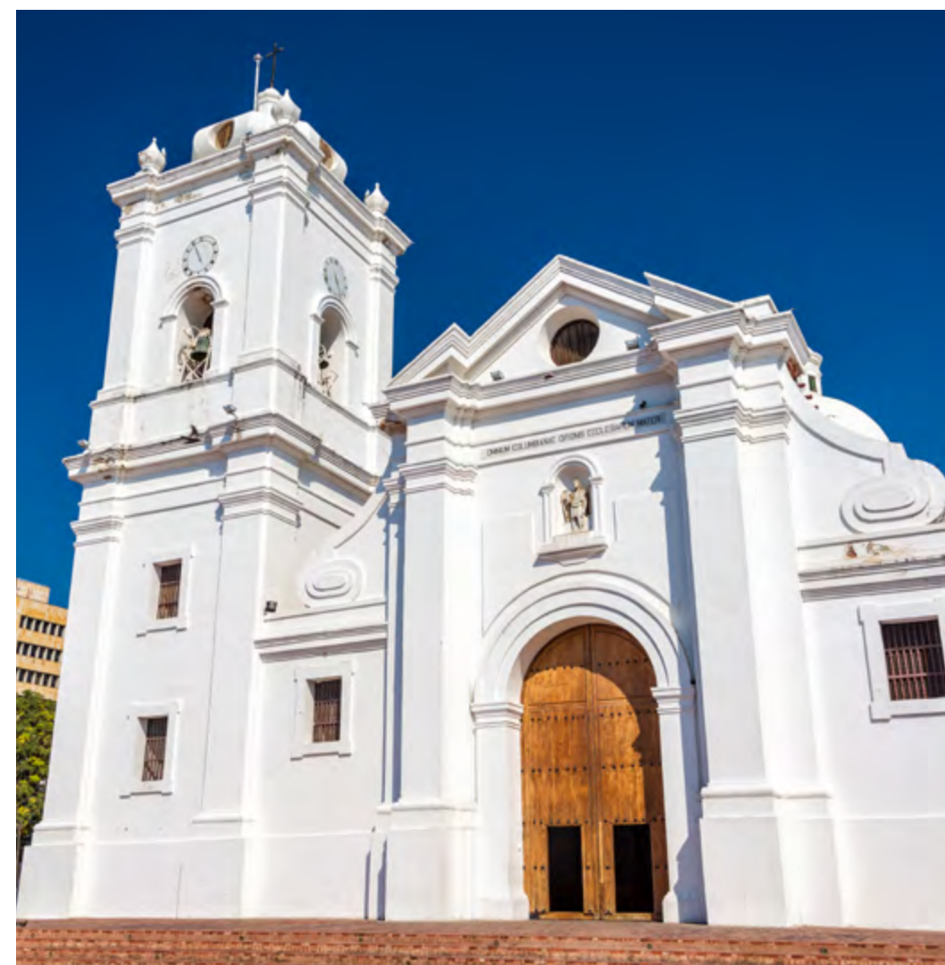
CATEDRAL DE SANTA MARTA

Vale a pena conhecer Santa Marta, cidade a 340 km de Cartagena, pois ela foi a primeira colônia espanhola na Colômbia. Ali, um dos destaques é a Quinta de San Pedro Alejandrino, onde morreu Simón Bolívar, o herói que lutou pela independência de vários países latino-americanos. Depois de um gostoso almoço típico incluído, você também caminha pelo setor colonial, onde ficam joias arquitetônicas como a Catedral, o Convento de Santo Domingo, o Museu do Ouro Tayrona e a Câmara Municipal. Inclui: transporte de ida e volta ao hotel, guia em espanhol, ingressos e almoço típico. Duração: 14 horas.