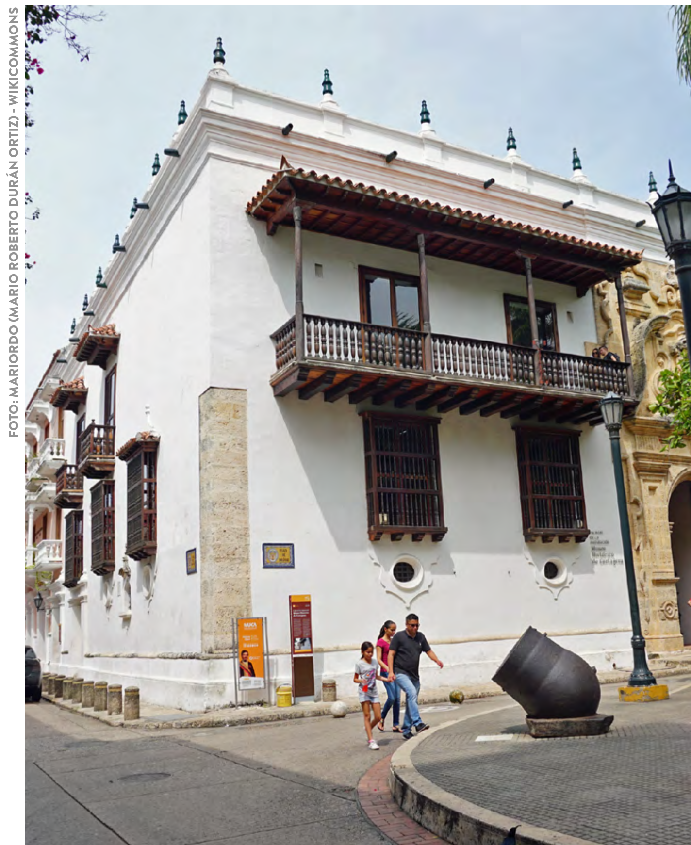
PALÁCIO DA INQUISIÇÃO

Cartagena tem uma série de museus que retratam diferentes temas de sua história. O Palácio da Inquisição é um casarão do século 18 onde a Igreja espanhola interrogava e punia os hereges e as “bruxas”. Hoje abriga o Museu Histórico, com réplicas de instrumentos de tortura. O Museu do Ouro, por sua vez, guarda peças feitas pela civilização zenu, que habitou o Norte da Colômbia até a chegada dos espanhóis. Já o Museu das Fortificações conta a história e o funcionamento das muralhas, enquanto o Museu Naval do Caribe recria o passado de Cartagena do ponto de vista marítimo.