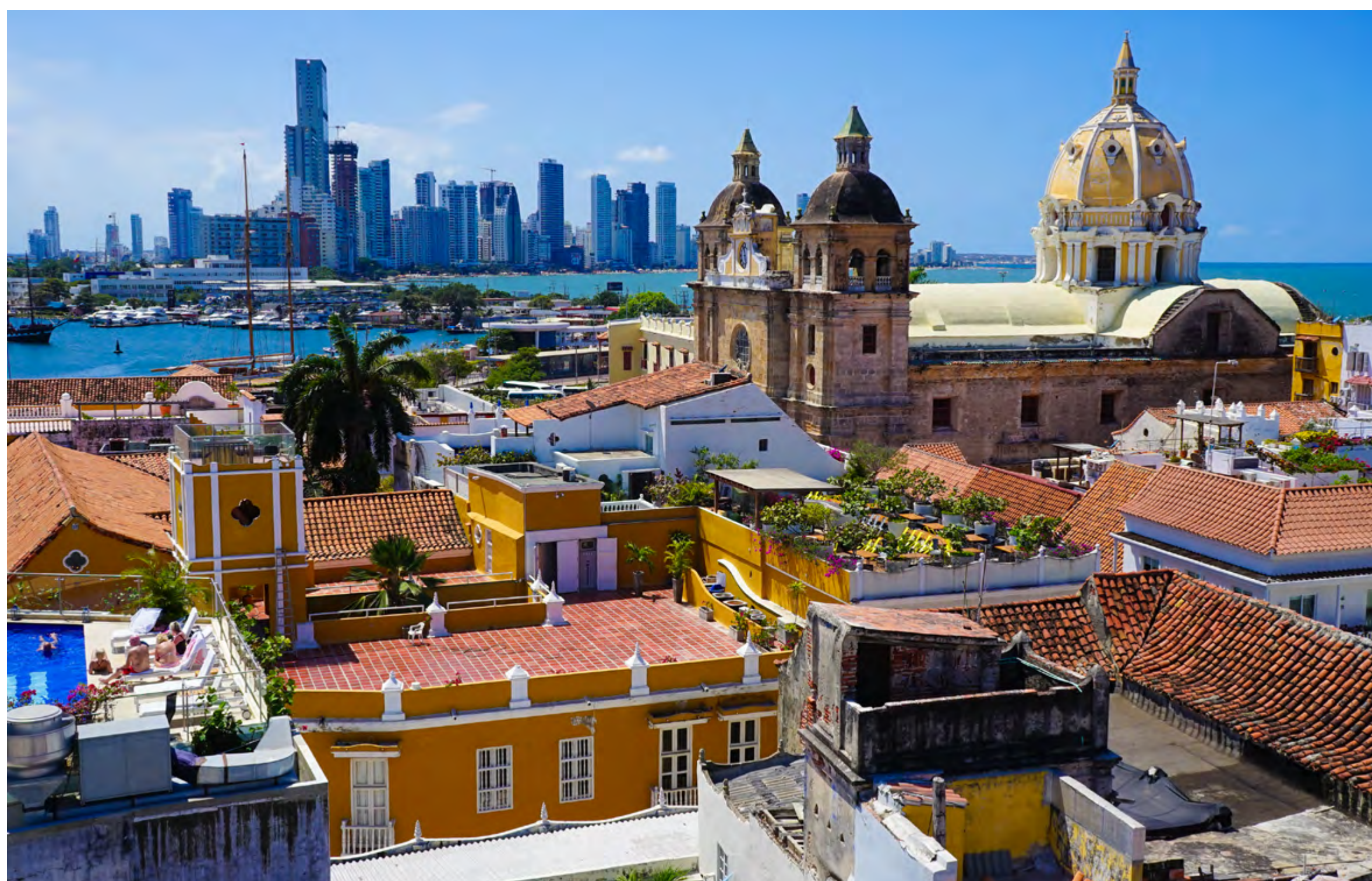
PANORAMA DO CENTRO HISTÓRICO, COM ÁREA MODERNA AO FUNDO