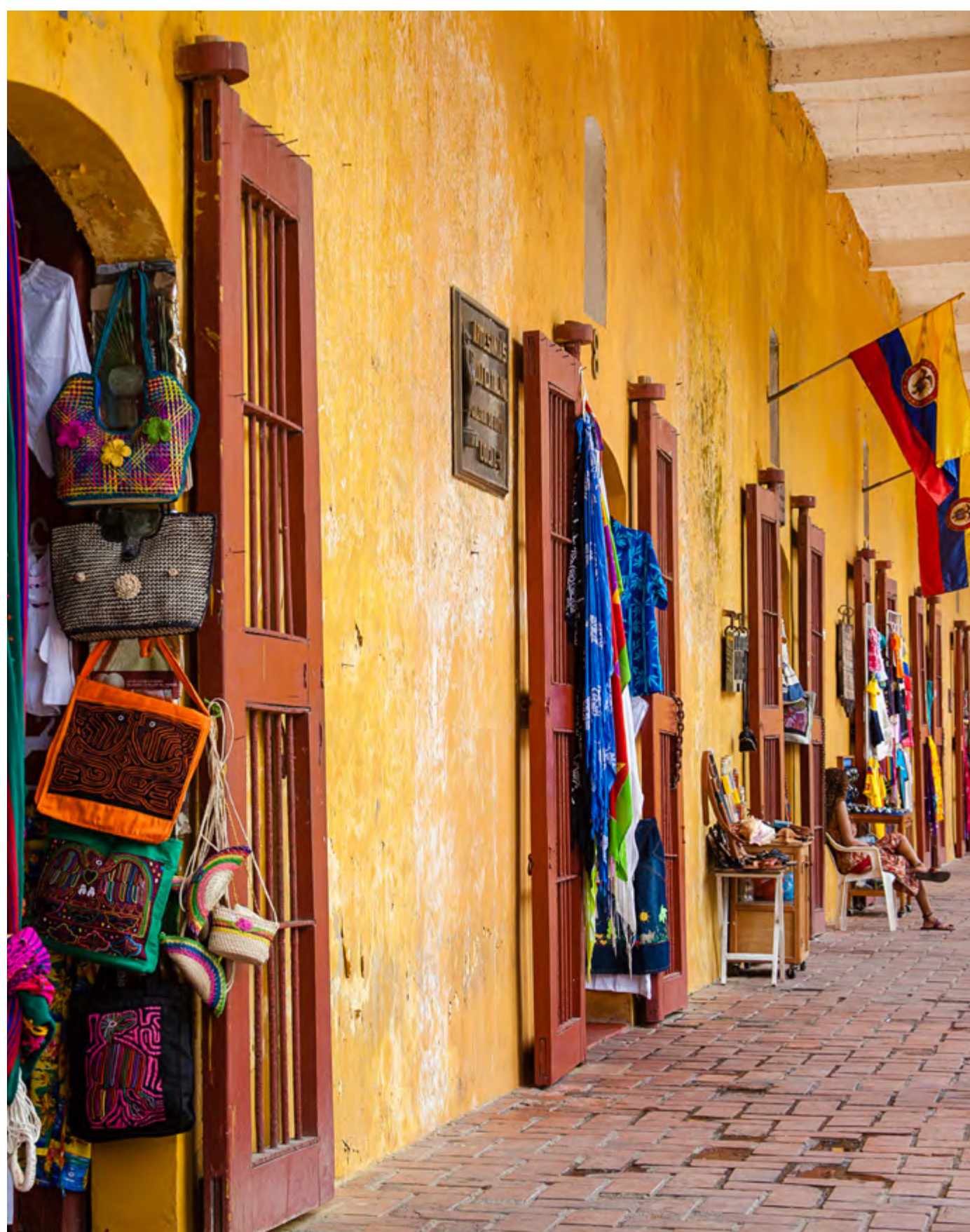
CUARTEL DE LAS BÓVEDAS

Cartagena conta com alguns shoppings, onde você encontra todo tipo de lojas e marcas, inclusive internacionais. Os principais são o Shopping NAO, o Plaza Bocagrande (ambos em frente à praia, no bairro de Bocagrande) e o La Serrezuela (em um antigo teatro, que lembra o Coliseu romano).