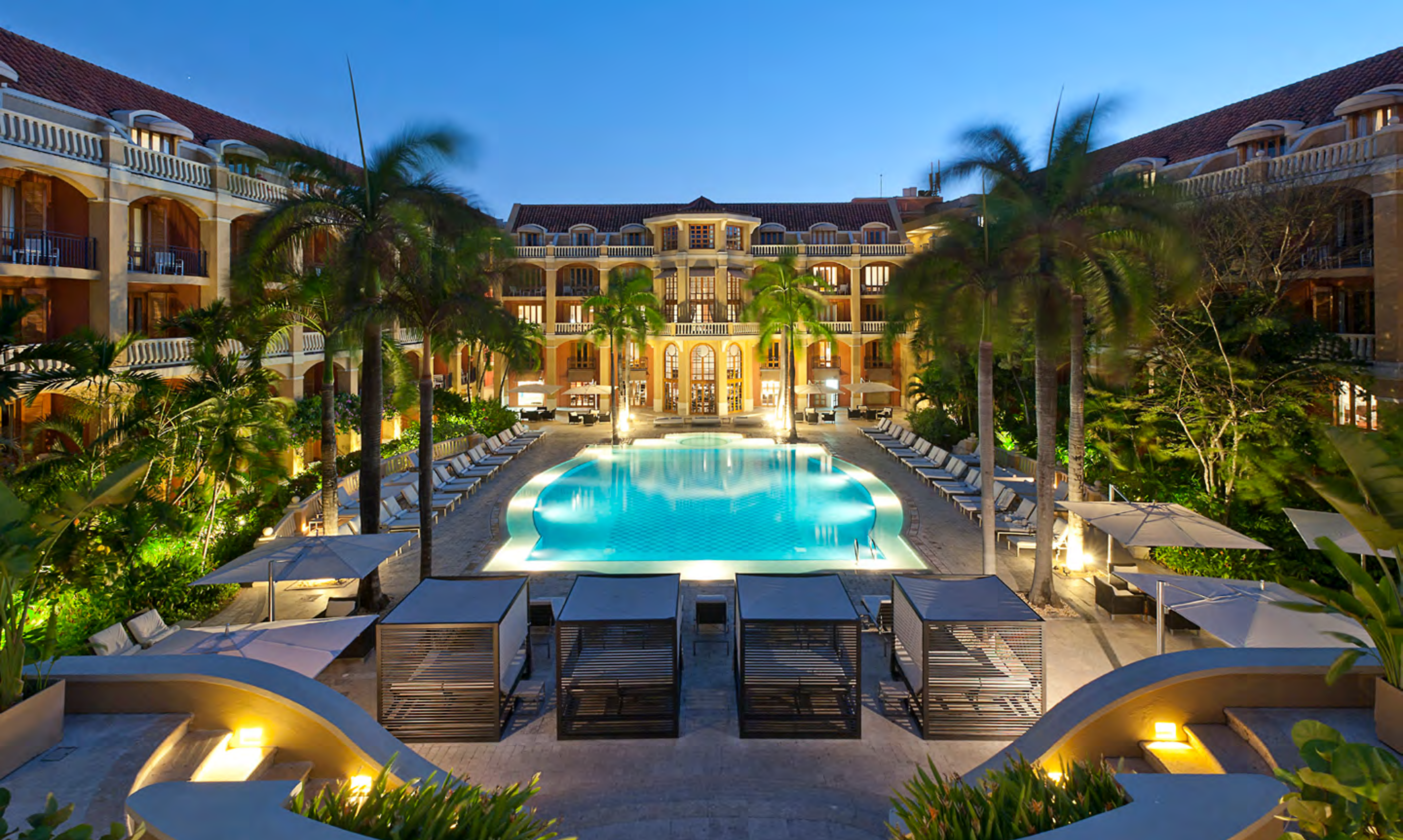
SOFITEL LEGEND SANTA CLARA