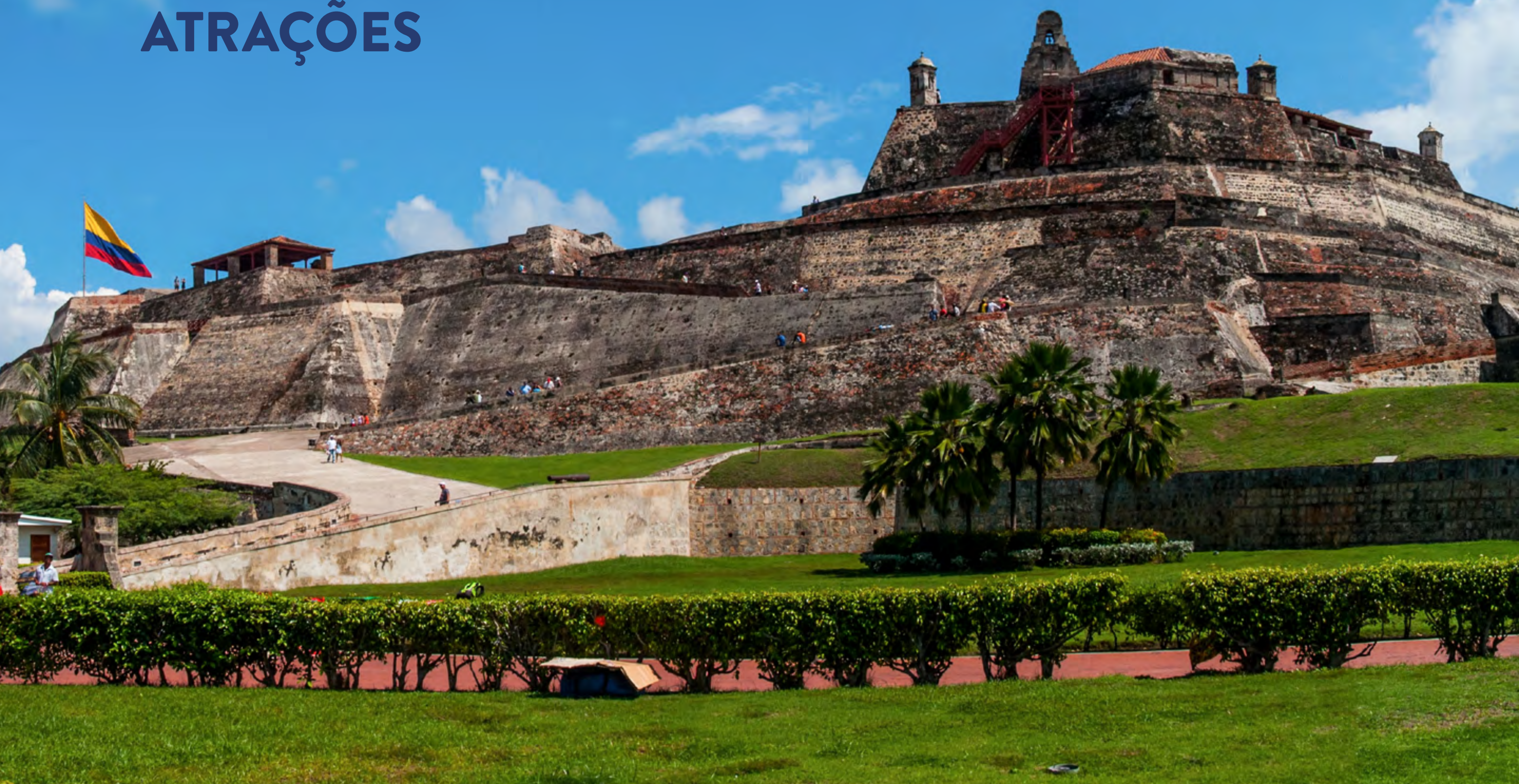
CASTELO DE SAN FELIPE DE BARAJAS