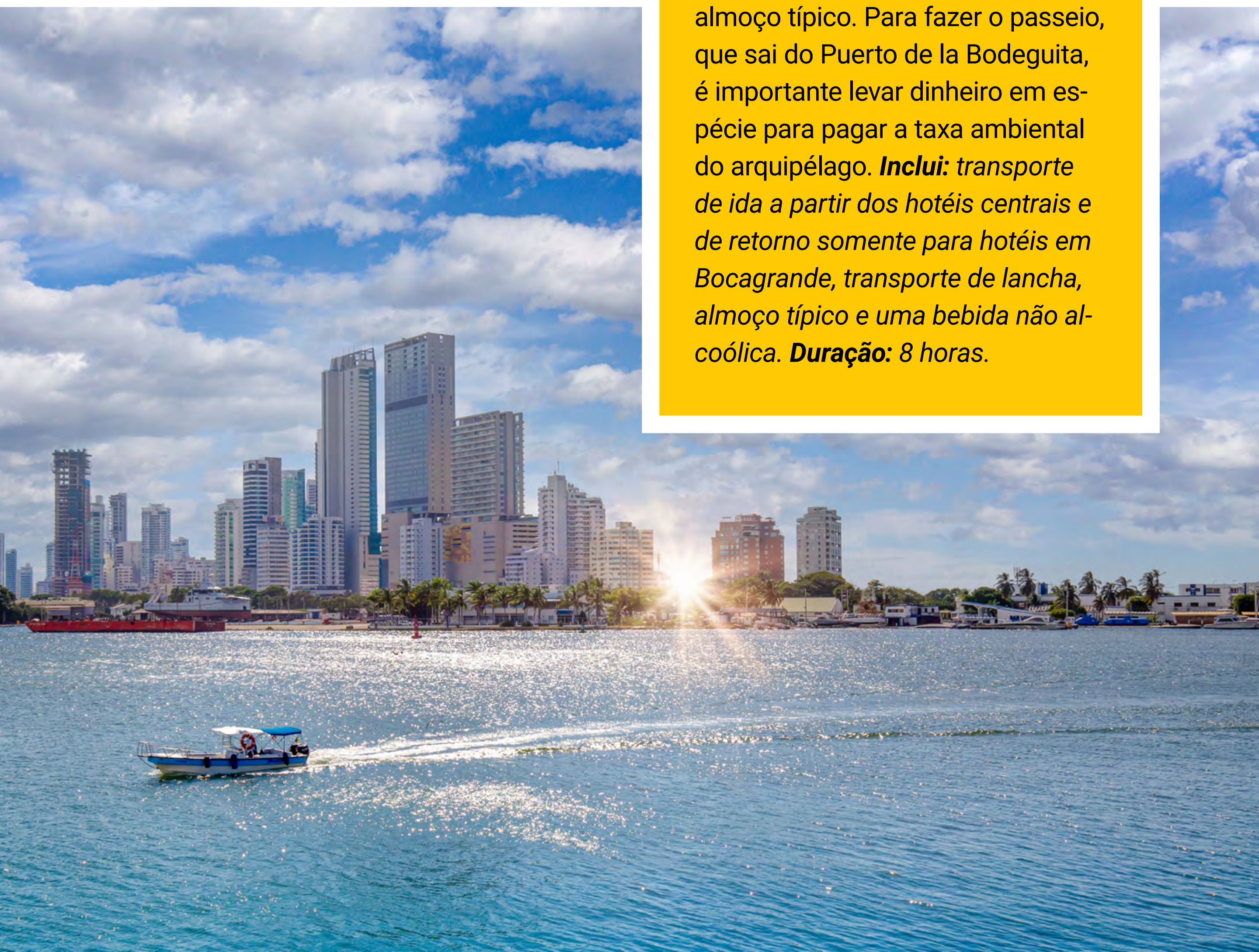
BAÍA DE CARTAGENA

De lancha rápida, você chega à Ilha do Sol, que faz parte do arquipélago de Rosário. Ali, toma banho de mar, mergulha com snorkel e faz uma visita opcional ao aquário, com shows de golfinhos e tubarões. Também se delicia com um almoço típico. Para fazer o passeio, que sai do Puerto de la Bodeguita, é importante levar dinheiro em espécie para pagar a taxa ambiental do arquipélago. Inclui: transporte de ida a partir dos hotéis centrais e de retorno somente para hotéis em Bocagrande, transporte de lancha, almoço típico e uma bebida não alcoólica. Duração: 8 horas.