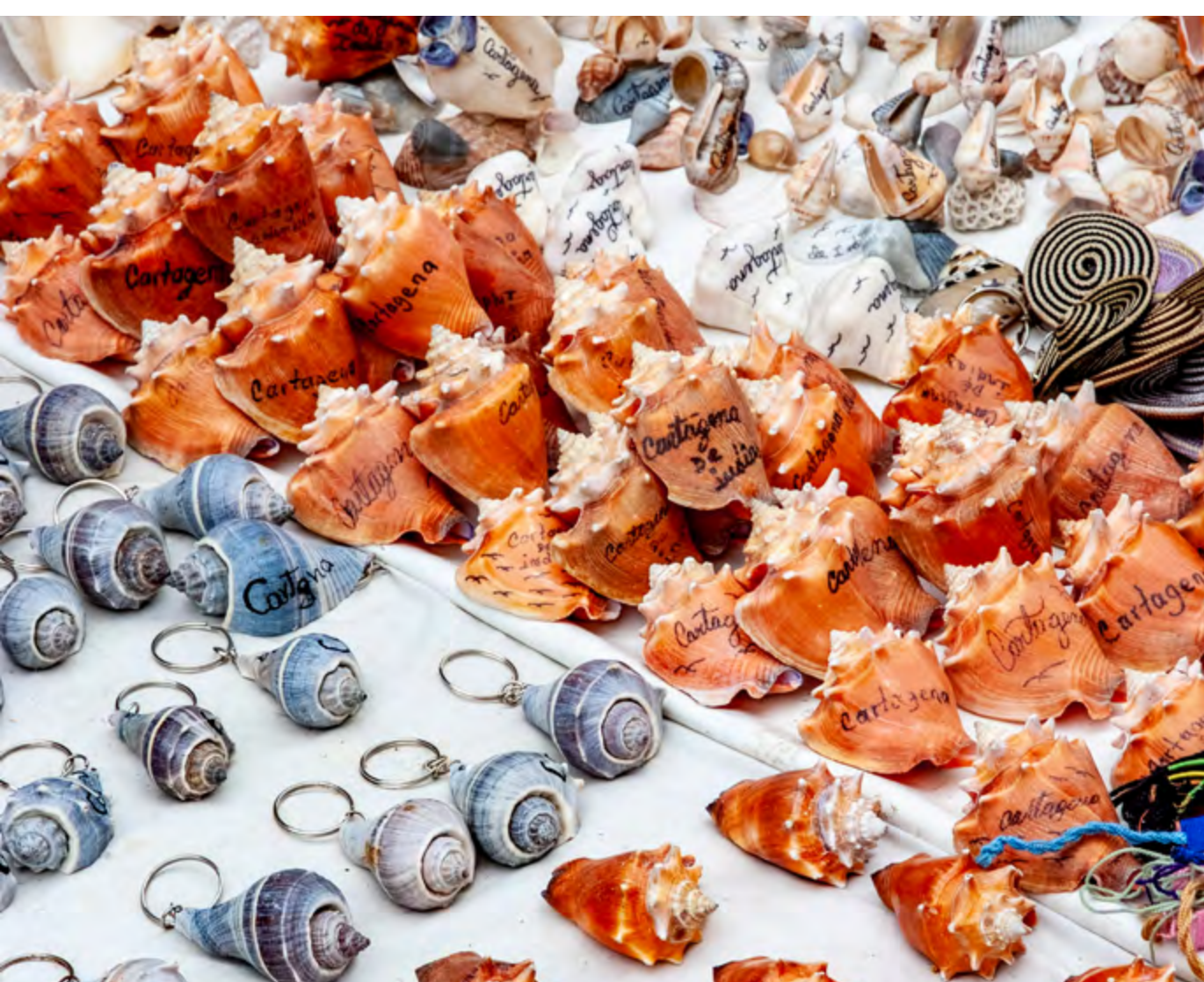
SUVENIRES COM CONCHAS