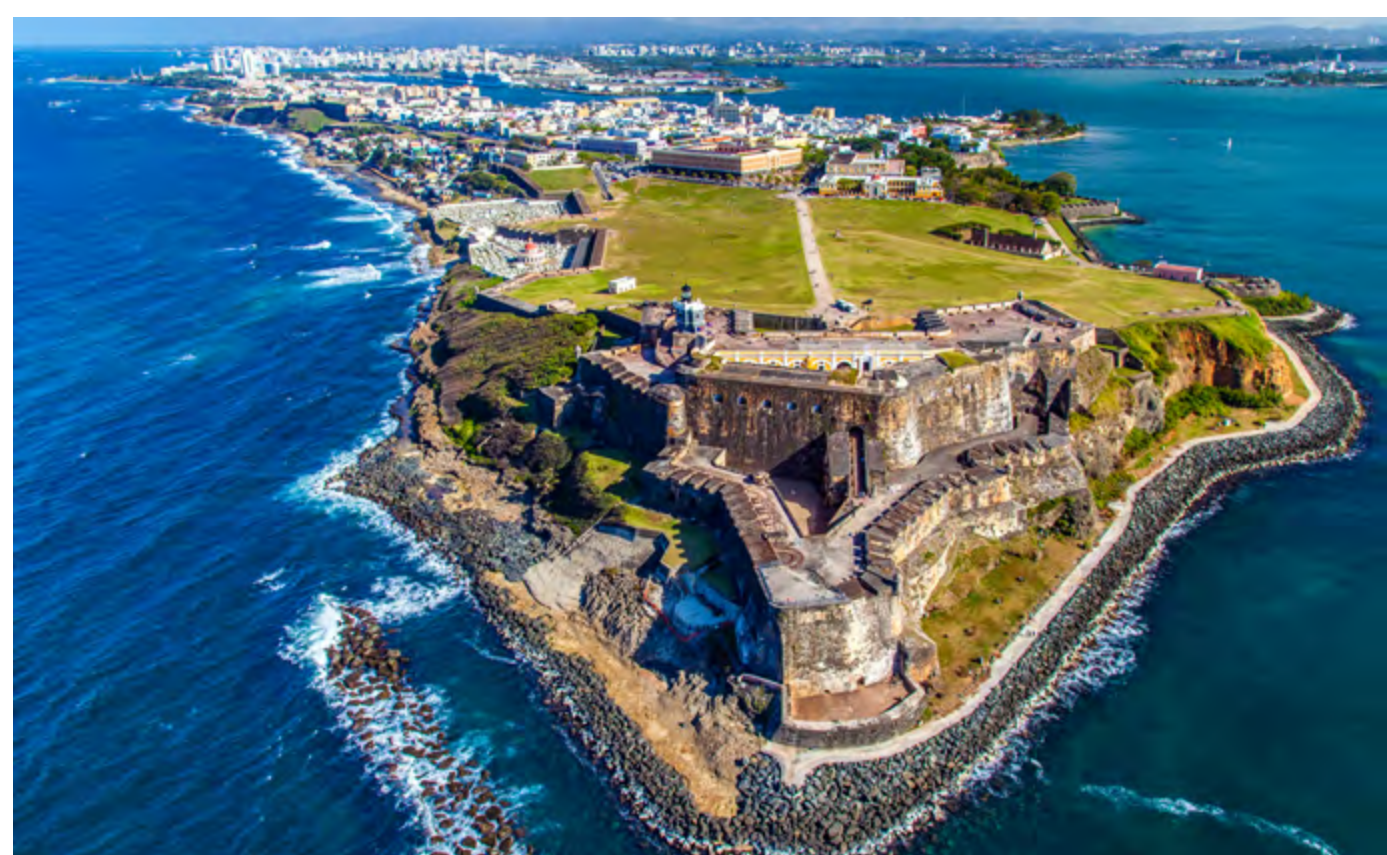
CASTELO DE SAN FELIPE DE BARAJAS

Você conhece a área moderna de Bocagrande e o bairro de Manga, com casas do início do século 19. Depois, visita o Castelo de San Felipe de Barajas, construído pelos espanhóis para se defender dos ataques ingleses no século 17. Por fim, uma breve caminhada pelo Centro Histórico e uma visita ao Museu da Esmeralda concluem esse charmoso passeio. Inclui: transporte de ida e volta ao hotel, guia em espanhol e ingressos. Duração: 4 horas.