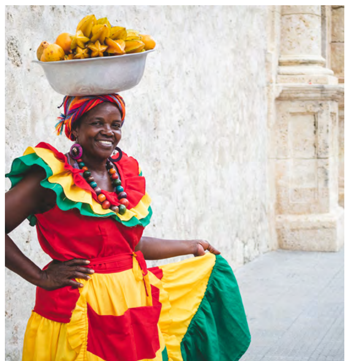
PALENQUERA VENDENDO FRUTAS NO CENTRO