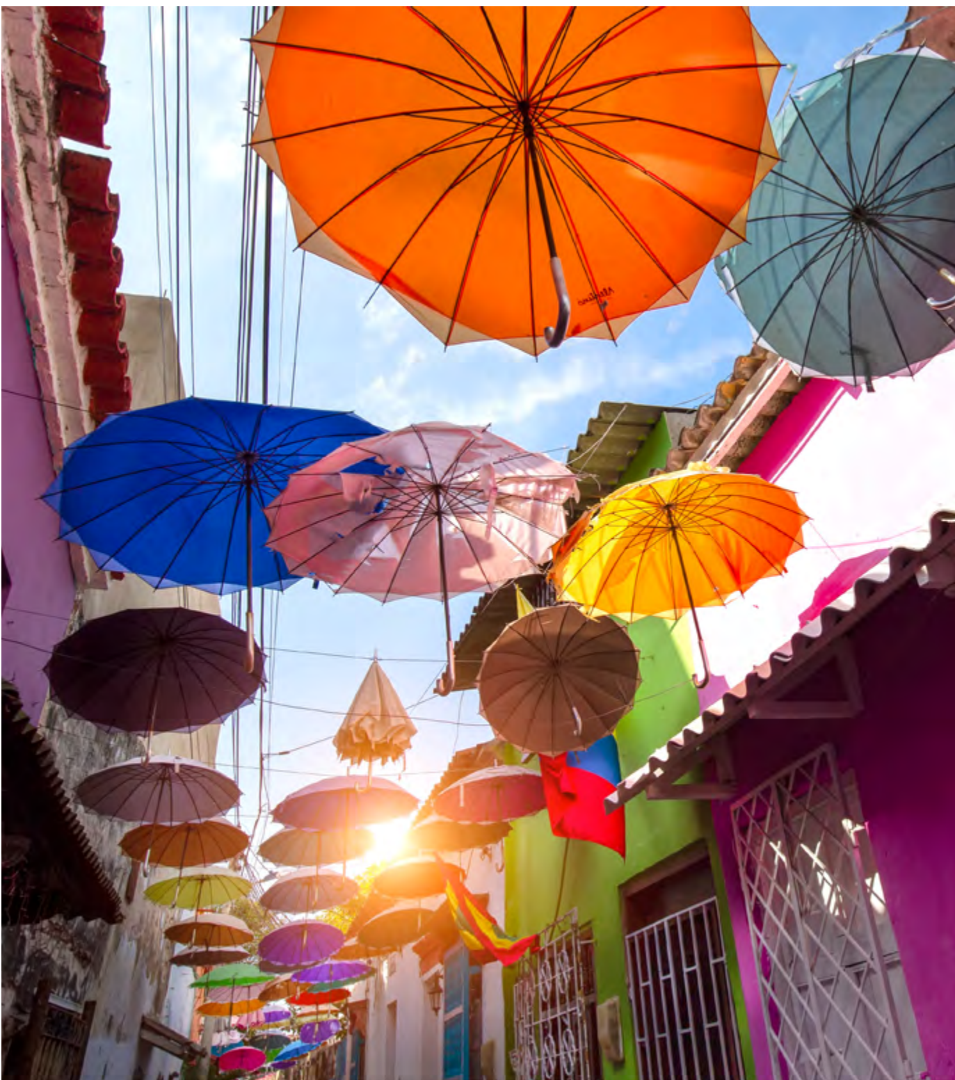
CALLE ANGOSTO, NO CENTRO HISTÓRICO

Os passeios destacados na sugestão abaixo estão nas páginas 9 a 11.