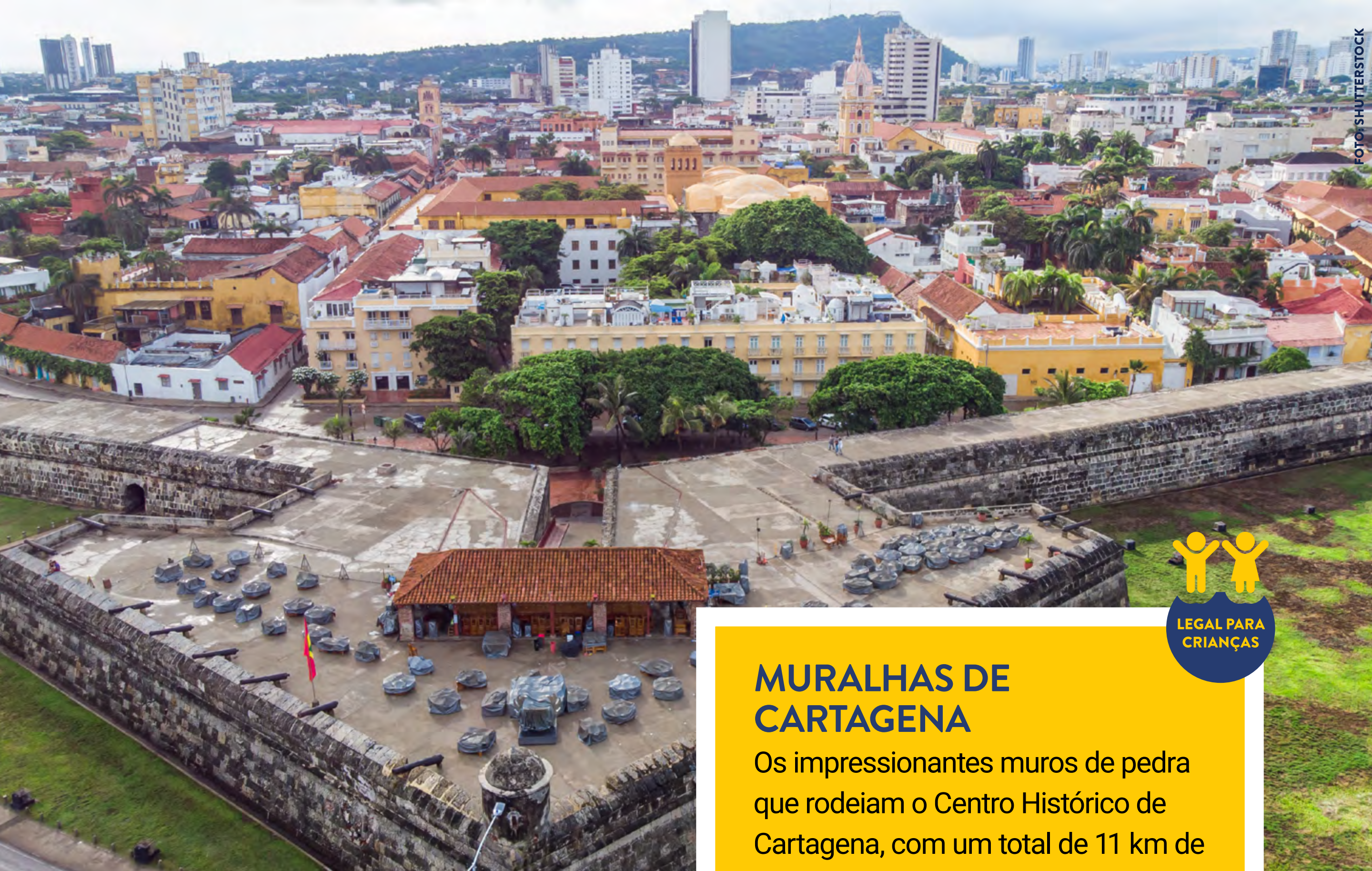
CAFÉ DEL MAR, NAS MURALHAS DE CARTAGENA