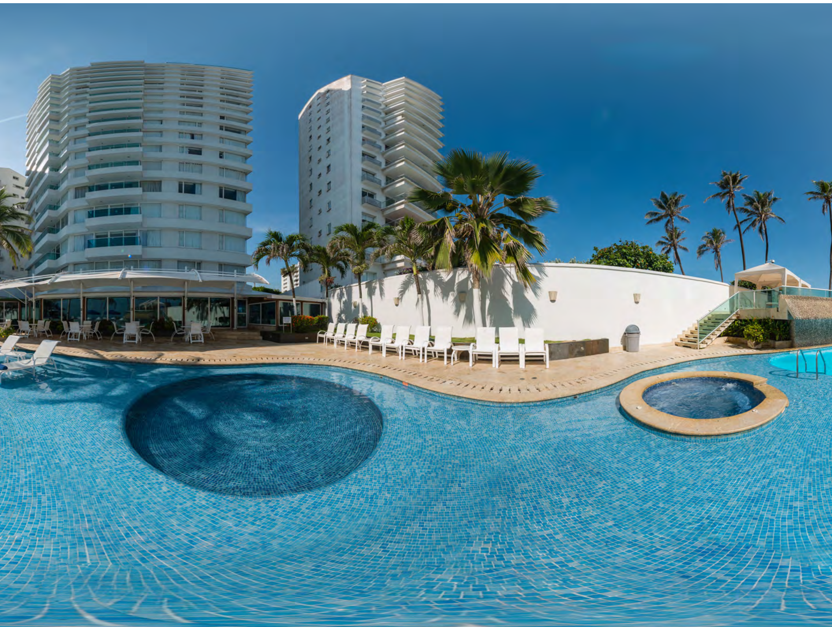
HOTEL DANN CARTAGENA