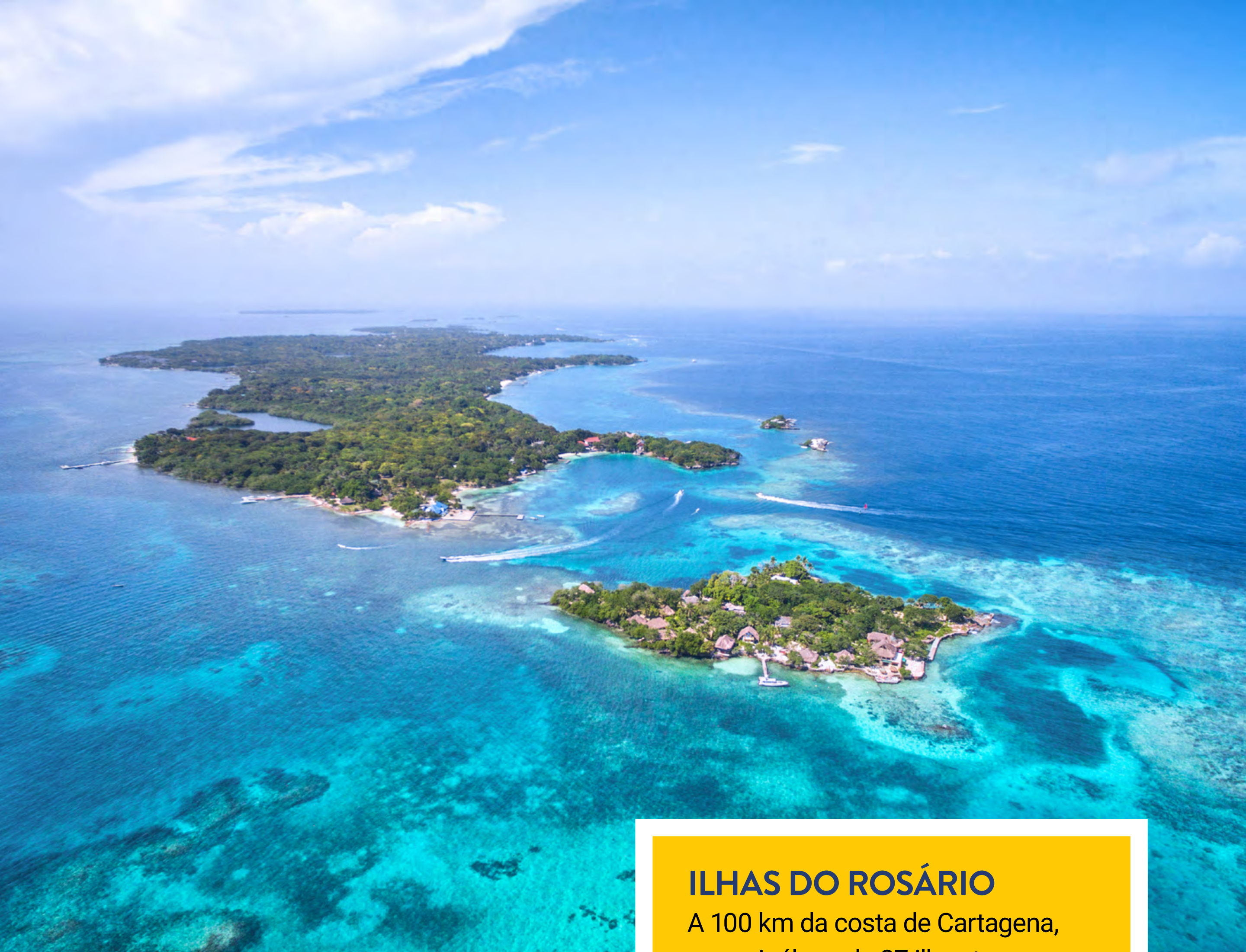
ILHAS DO ROSÁRIO