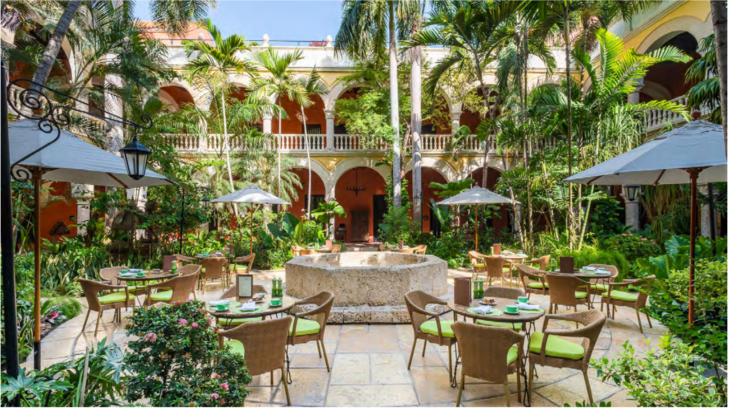
SOFITEL LEGEND SANTA CLARA

Reserve sempre seu hotel com a CVC para garantir tarifas imperdíveis e, dependendo do hotel, benefícios como entrada antecipada e saída em horário estendido dos apartamentos, upgrade de categoria, mimos especiais e muito mais. Consulte condições e disponibilidade dos hotéis participantes.