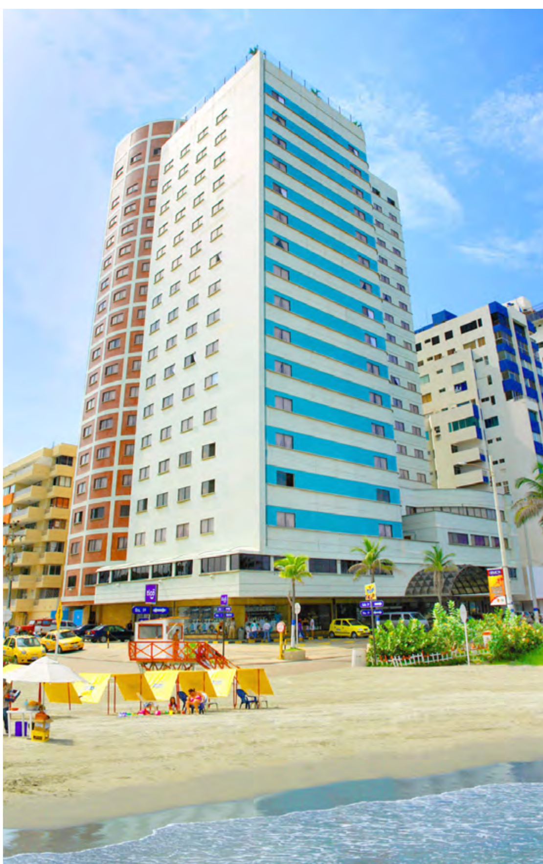
HOTEL CARTAGENA PLAZA

HOTEL CARTAGENA PLAZA A 3 km do Centro Histórico, o hotel com sistema Tudo Incluído, no bairro de Bocagrande, tem quartos confortáveis para um bom sono ou, então, uma badalada discoteca para quem prefere curtir a noite. As crianças aproveitam atividades na piscina, shows e muita diversão com a equipe de monitoria. Carrera 1, 6-154, Bocagrande.