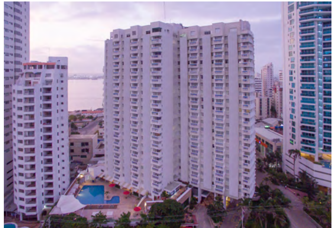
HOTEL DECAMERON CARTAGENA

IBISCARTAGENAMARBELLA É muito boa a localização deste hotel, que fica no bairro de Marbella, a 2 km do Centro Histórico. Você curte a vista para o mar do seu próprio quarto e também toma deliciosos coquetéis no lounge. Av. Santander, 47-90, Marbella.