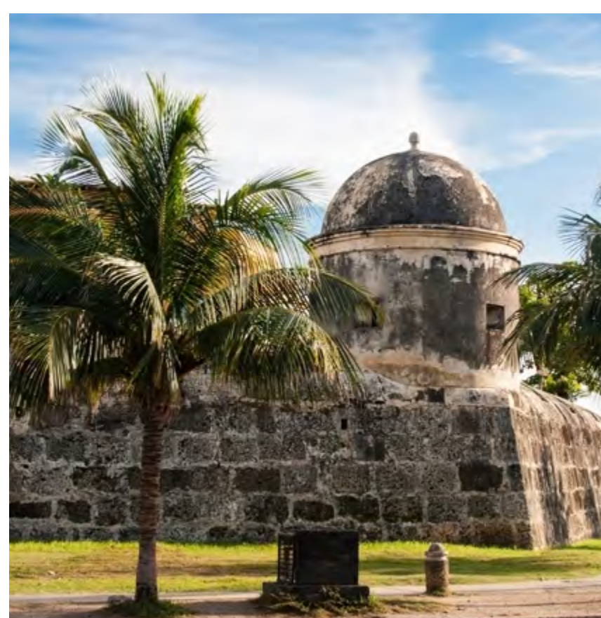
MURALHAS DE CARTAGENA