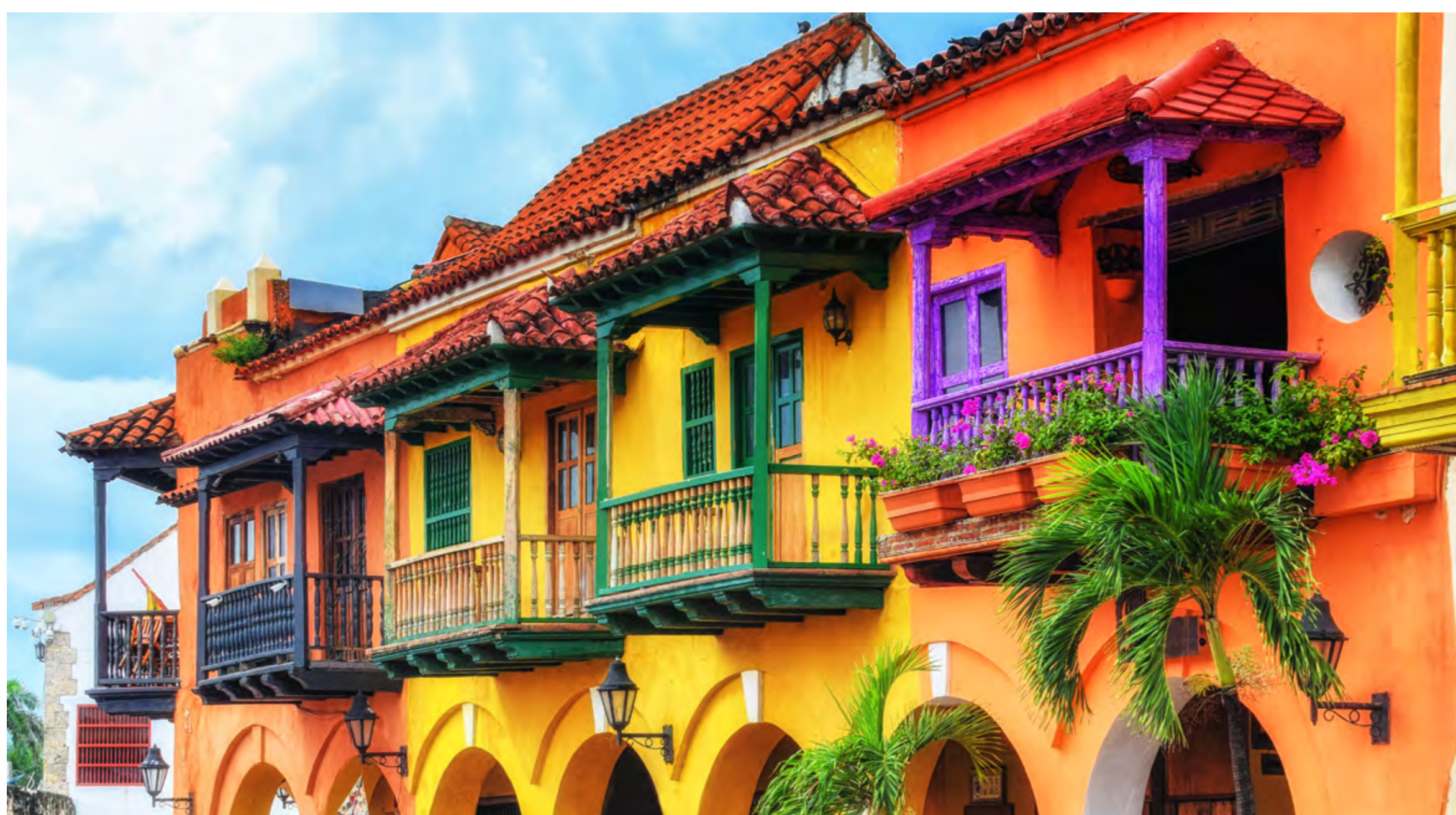
CASAS COLONIAIS NO CENTRO HISTÓRICO