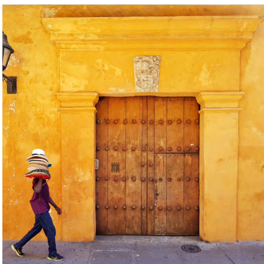
VENDEDOR NO CENTRO HISTÓRICO

A voltagem em Cartagena é de 110 volts. A tomada é de dois pinos chatos.