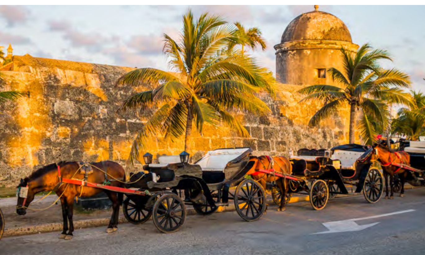
CARRUAGEM EM FRENTE ÀS MURALHAS