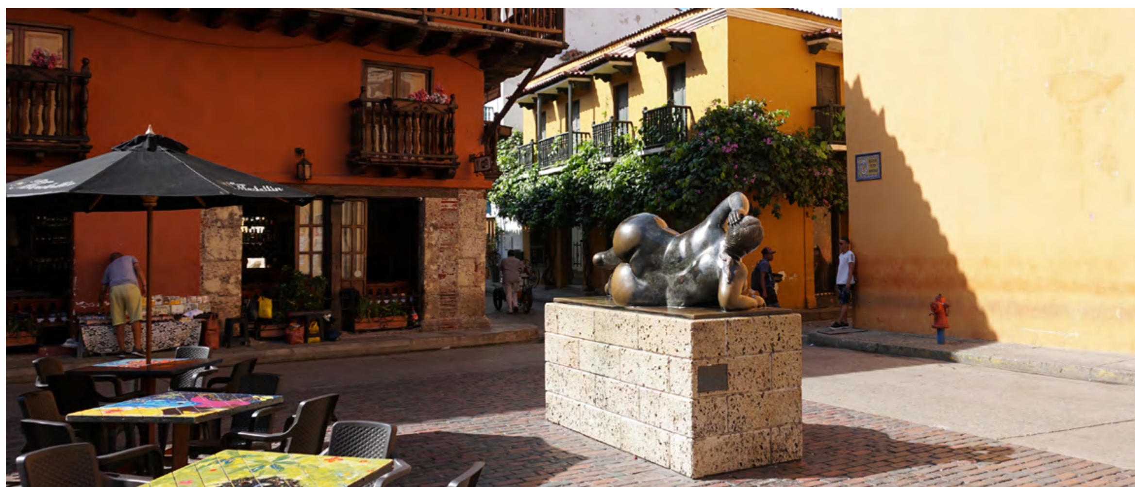
ESCUPTURA LA GORDA, NA PLAZA SANTO DOMINGO

A praça, dentro do Centro Histórico, é um dos melhores pontos da cidade para apreciar o pôr do sol e ouvir música típica ao vivo, nos fins de semana, nos bares e restaurantes que têm mesas ao ar livre.